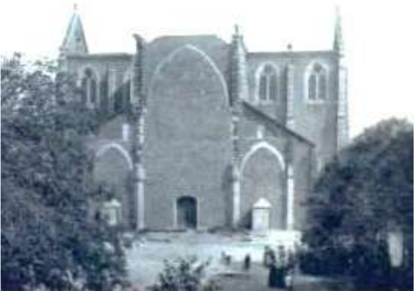
L'église après l'incendie de 1906 trouver une meilleure photo

Il faudra attendre 1931 pour que les travaux d'achèvement reprennent. La flèche du clocher ne sera jamais construite, toujours par manque de moyens.