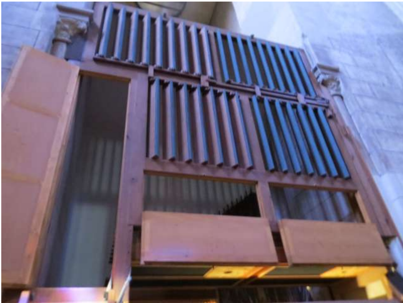
La boîte expressive de Wolf

Le Récit expressif est situé dans une « boîte » conçue par Wolf. D'une efficacité remarquable celle-ci a été intégralement conservée et restaurée.