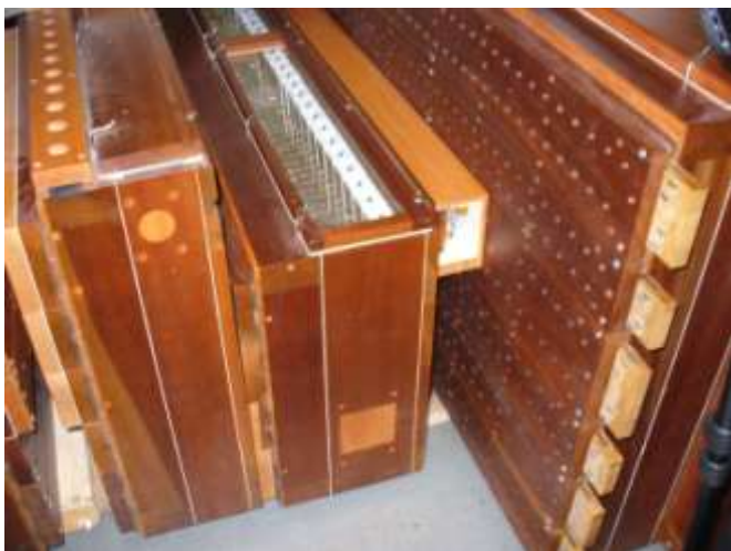
Les sommiers de Wolf restaurés

Les sommiers de Wolf ont été restaurés à l'identique. Les nouveaux sommiers du Grand orgue ont été réalisés en copie des sommiers de Wolf, avec une essence de bois voisine de l'acajou utilisé. Les sommiers « unit » sont de conception moderne.