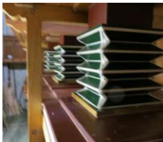
Autres réservoirs avec leur gosier de liaison