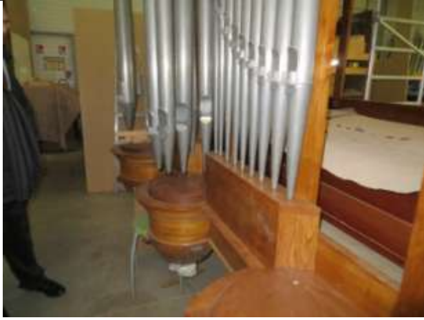
Le buffet du Positif à l'atelier après rehaussement