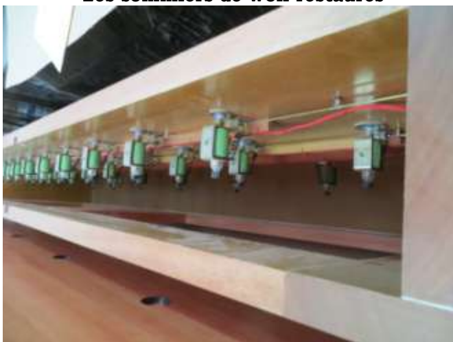
Intérieur d'un sommier « unit »