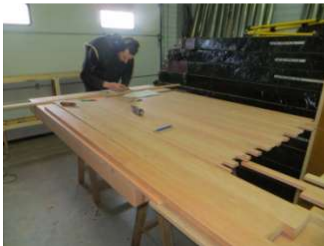
Les sommiers de GO en construction