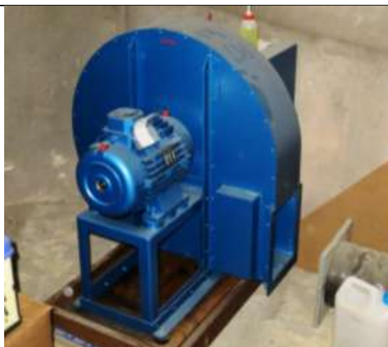
Le nouveau ventilateur