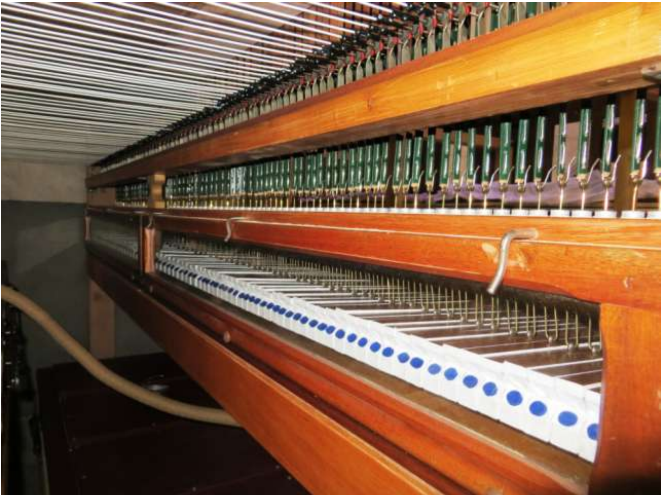
La boîte du Récit

Pour les nouveaux sommiers du Grand orgue, des électroaimants à tirage direct ont été utilisés.