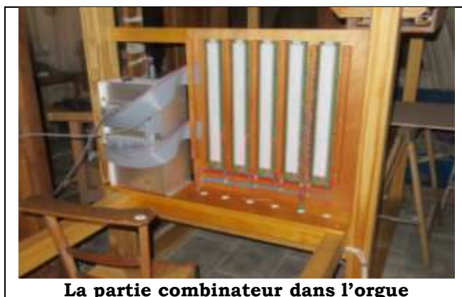
La partie combineur dans l'orgue

Le combineur utilisé pour la transmission des notes et des jeux est un modèle Orgdrive de la société italienne Eltec.