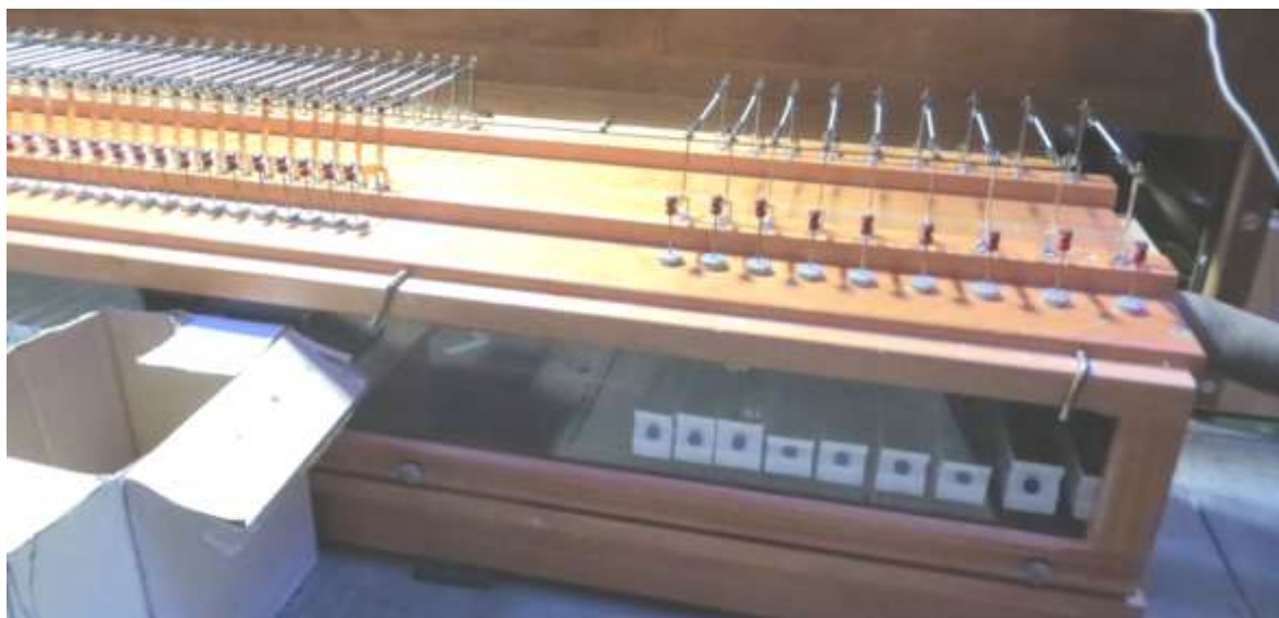
Boîte de commande Wolf du Positif, modifiée.

Pour le Positif, les électroaimants étant inaccessibles, la boîte de tirage des notes a été déplacée et des balanciers ont été créés pour tirer les soupapes du sommier. La boîte est située devant le Positif et une passerelle est aménagée au-dessus.