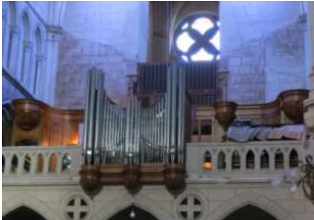
Le positif en place