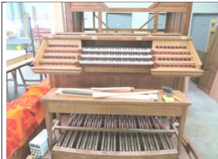
La console neuve à l'atelier de Carquefou

Une nouvelle console a été construite dans le style de Cavallé-Coll, seuls les claviers et le pédalier de Wolf ont été conservés après restauration.