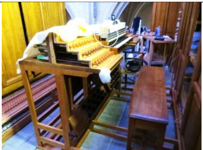
La console en place au début des travaux d'harmonisation