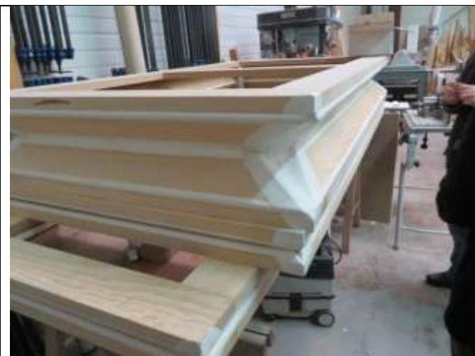
Un réservoir restauré à l'atelier

Le ventilateur d'origine ayant lâché au moment de sa remise en service, celui-ci a été remplacé par deux ventilateurs neufs.