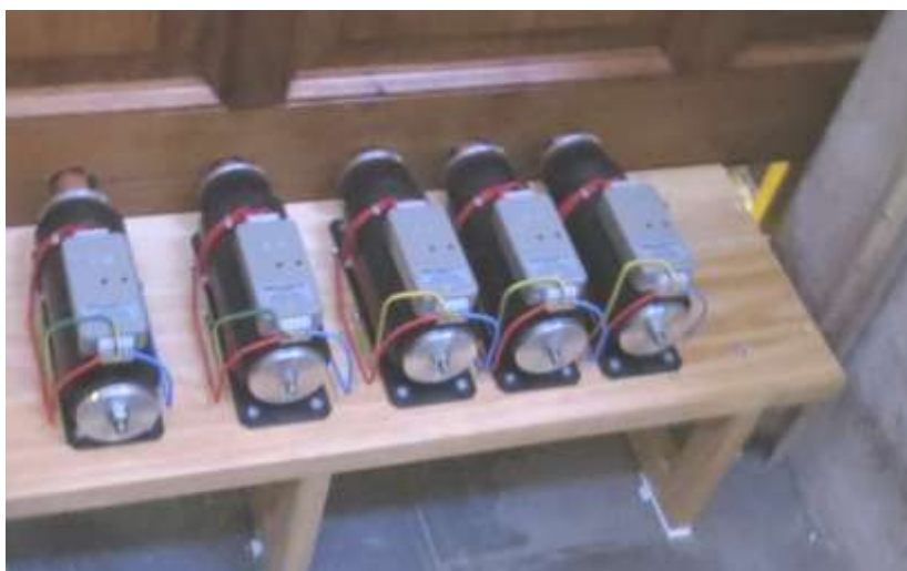
Les moteurs de tirage de jeux

Le tirage des jeux est effectué par des moteurs linéaires Kimber-Allen en remplacement du système pneumatique de Wolf arrivé en fin de vie.