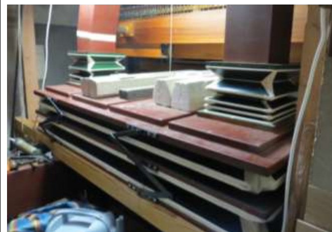
Le même réservoir en place