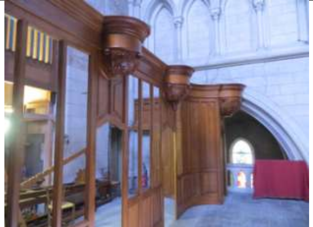
Le buffet du GO après ponçage et nouveau vernis