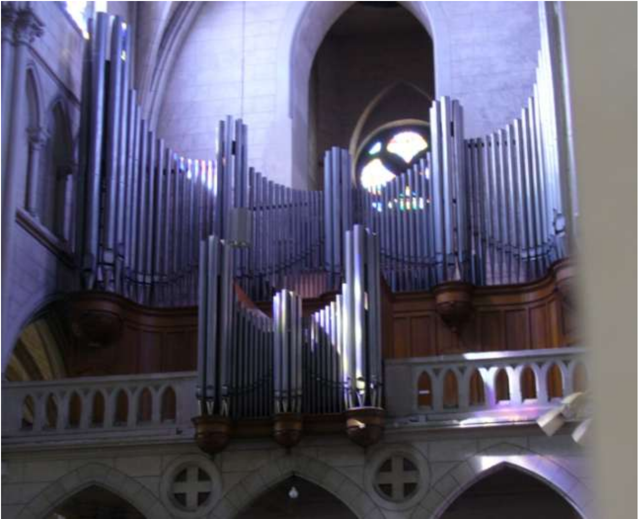
L'orgue Wolf avant restauration

Au fil du temps, l'envie de posséder de grandes orgues se fit de plus en plus sentir. Il faudra attendre les années 1950, avec la volonté du Père Charles Costard qui trouvera les fonds nécessaires à la construction d'un Grand-orgue 1 .