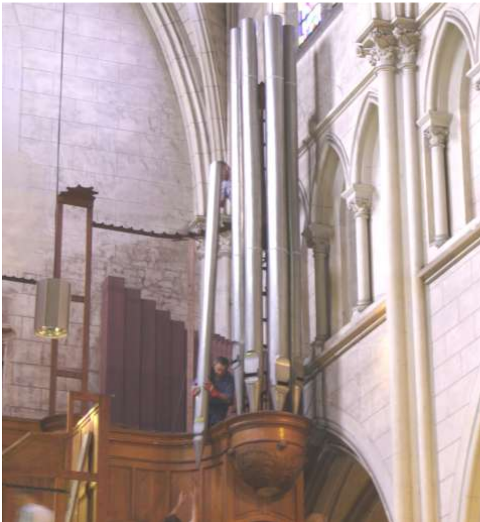
L'orgue en cours de démontage en août 2011

Le choix de la commission des marchés a porté sur la note technique, la qualité du matériel et des nouveaux jeux proposés, leur mise en harmonie, le prix et le service après-vente. Le marché est signé pour la somme de 371 903 euros hors taxes.