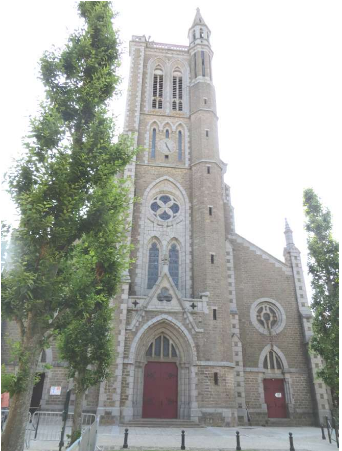
L'église Saint-Méen de Cancale aujourd'hui