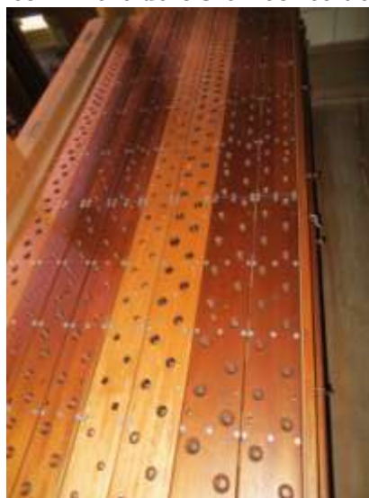
Un sommier du Récit en place avant le « plantage » de la tuyauterie